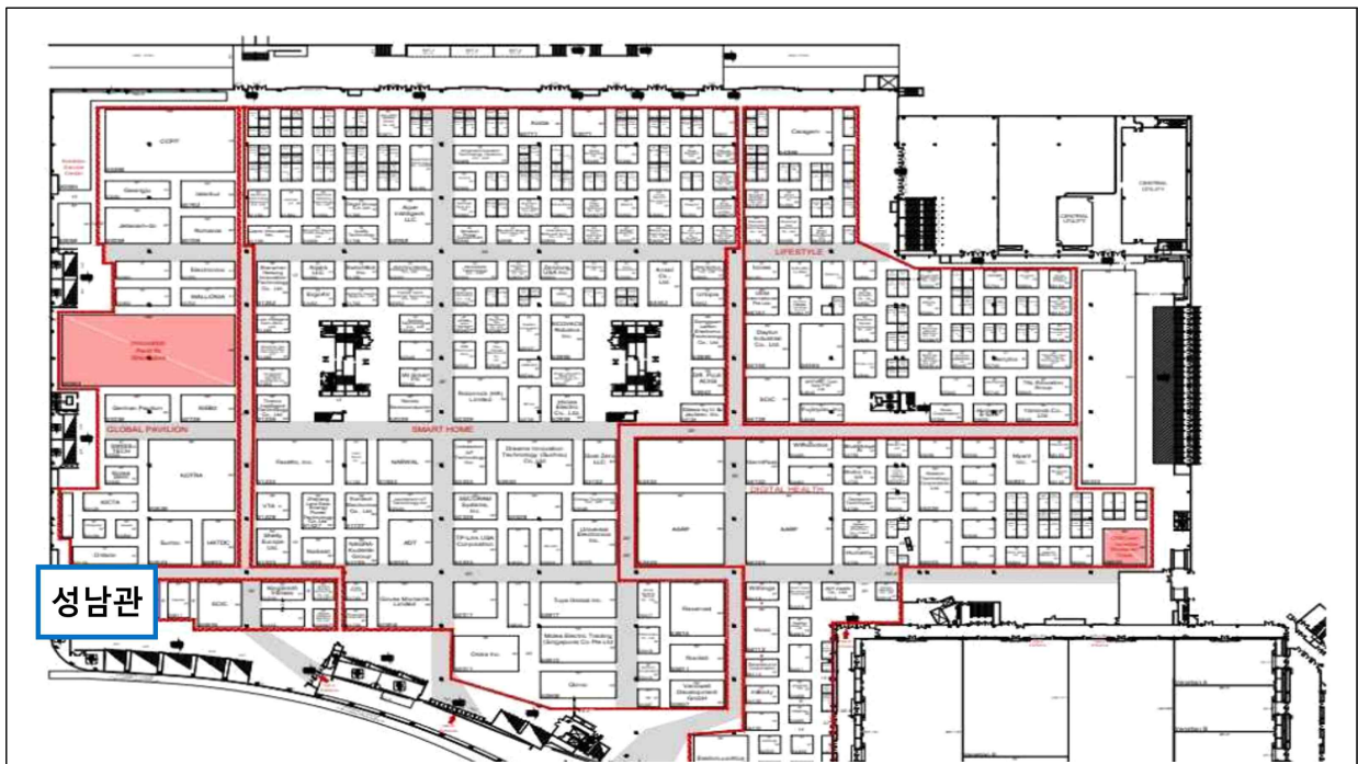
[CES 2026 성남관 위치 / Venetian Expo 2층]