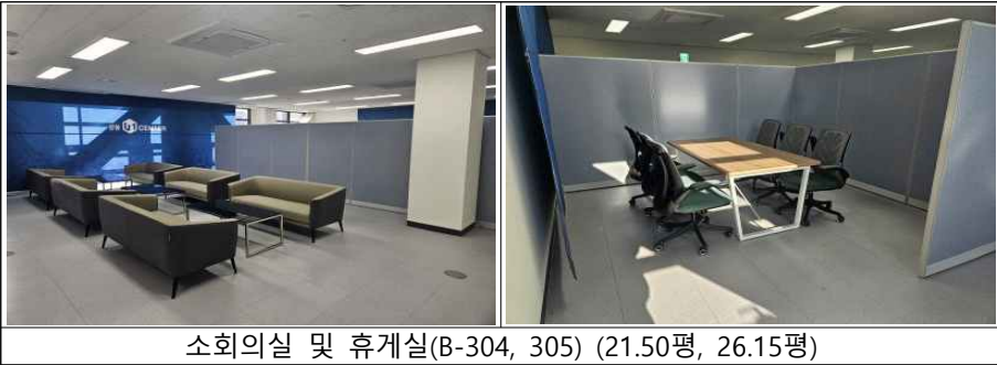
소회의실 및 휴게실(B-304, 305) (21.50평, 26.15평)