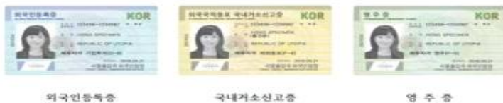
[신형 외국인등록증 3종 이미지]