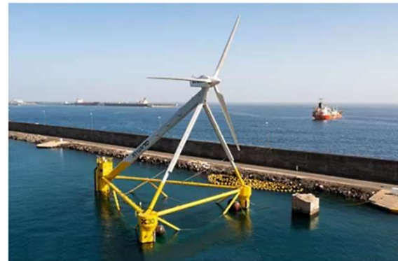
The X30 Floater: X1 Wind's Unique Floating Wind Turbine Design

Approximately 70% of the Earth's surface is covered by oceans, representing a 140 million square mile area that holds enormous potential for floating wind turbine applications. According to the International Energy Agency (IEA) , an organization dedicated to helping countries achieve sustainable energy objectives through authoritative analysis, data, policy recommendations and real world solutions the technical potential for offshore wind worldwide is 120,000 Gigawatts (GW), enough to meet the projected global demand for electricity 11 times over in 2040. So just how does an offshore floating wind turbine fit into this scenario?